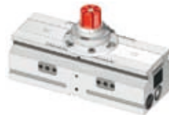
採用反張模組夾頭